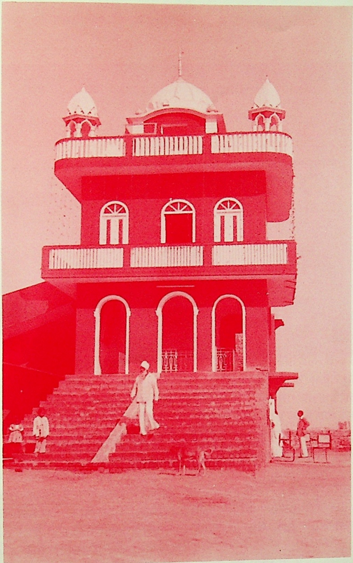
SACHKHAND NANAK DHAM New Dehli India