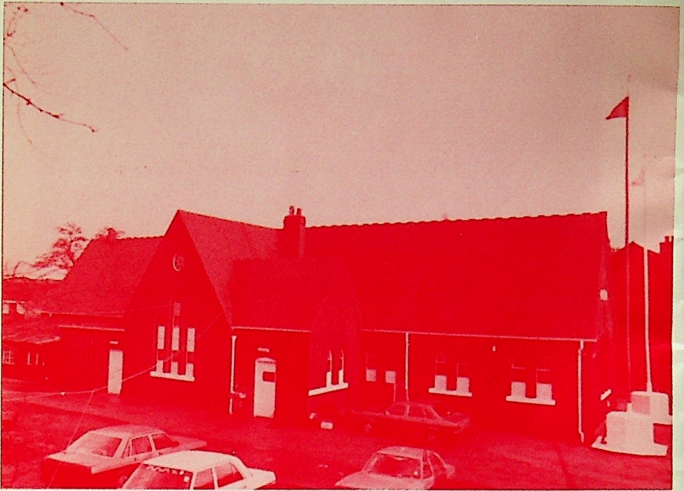
SACHKHAND NANAK DHAM Birmingham U.K.